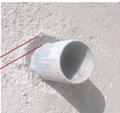
Abrir con martillo y escarpa la zona alrededor del tubo en forma de uve "V". ESTE ANCHO ES INSUFICIENTE!!