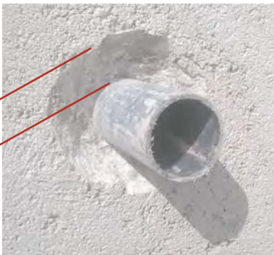
Este ANCHO y PROFUNDIDAD sí son correctos.