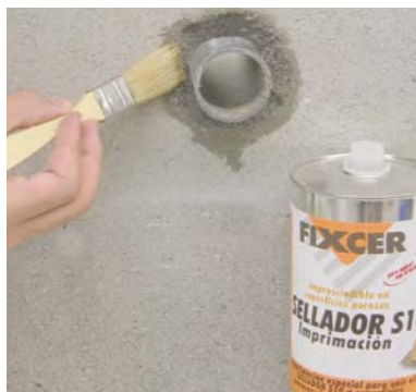
En soportes ABSORBENTES, aplicar primero la IMPRIMACION SELLADOR S10 .

SELLADOR S10 es un elastómero poliuretánico de alta calidad, especialmente indicado para dar respuesta a las exigencias técnicas del Sistema 10® de Rosa Gres: adhesión, estanqueidad, durabilidad y resistencia al agua de las piscinas. Con estas características, es también ideal para sellar juntas de dilatación sometidas a esfuerzos extremos: cámaras frigoríficas a -30°C, suelos radiantes, fachadas sometidas a fuerte insolación en verano y a intenso frío en invierno, etc. etc.